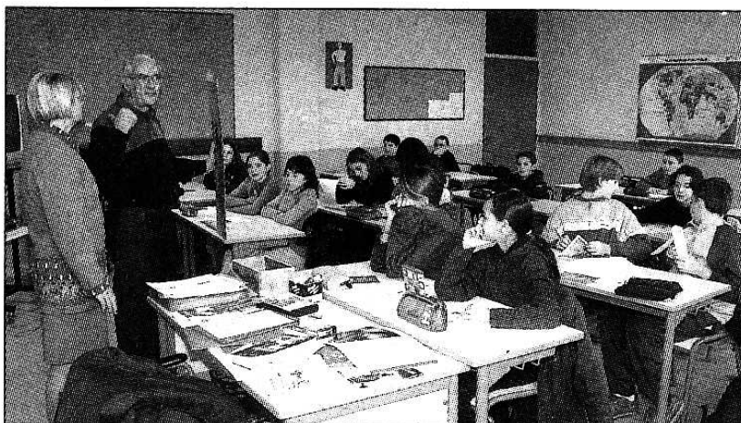
La présentation de la lutte contre le tabac dans les classes.